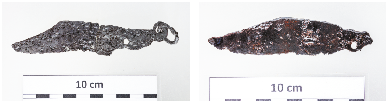
17. kép. Bicskapengék Tamási-Henyéről

a tárgyakhoz. Evőeszközként való használatuk ellen azzal érvelt, hogy túl kevés került elő belőlük a várfeltáráson. 86 Gaál Attila Szekszárd-Palánkról hat példányt mutatott be, hozzátéve, hogy ezek multifunkcionális eszközök voltak, és nem lehet őket kizárólagosan egyetlen mesterséghez kötni őket. 87 Belgrádból a 16–17. századra kelteztve borotvapengéként közöltek egy hasonló tárgyat. 88