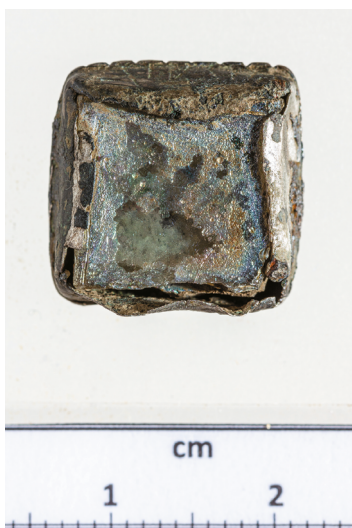
6. kép. Négyzet alakú köves foglalat Tamási-Henyéről