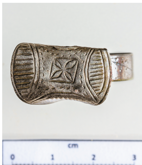
7a-b. kép. Nyaktagos ezüstgyűrűk Tamási-Henyéről és Pincehely-Dorogról