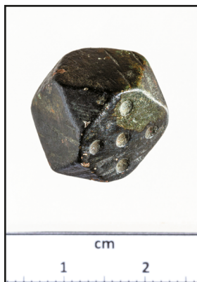
2. kép. Oszmán-török mérlegsúly Nagyszokoly-Szentmártonból