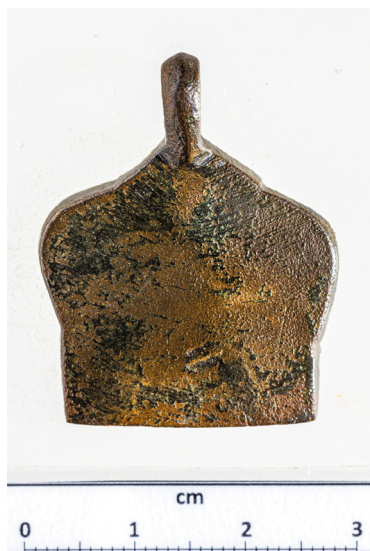
12. kép. „Tulipán alakú” kapocs Tamási-Henyéről