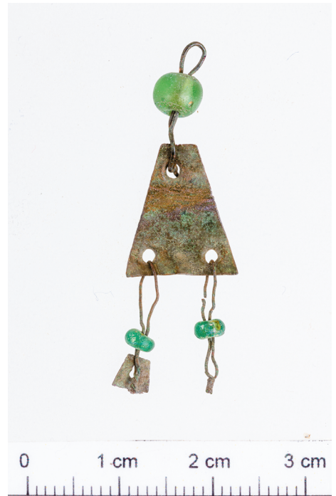
5. kép. Flitter gyönggyel díszített dróttal és másik flitter töredékével Pincehely-Gyántról