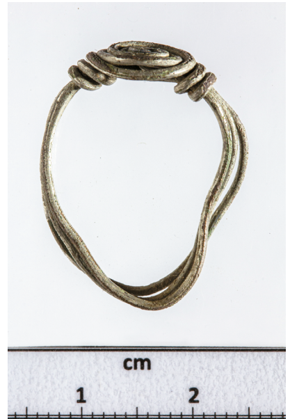
10. kép. Drótygyűrű Pinchehely-Dorogról