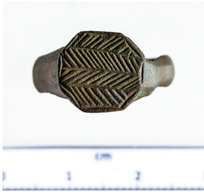
8a-b. kép. Geometrikus díszű gyűrűk Tamási-Adorjából