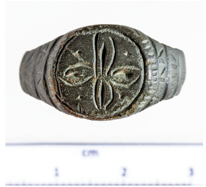
8c. kép. Geometrikus díszű gyűrű Tamási-Henyéről