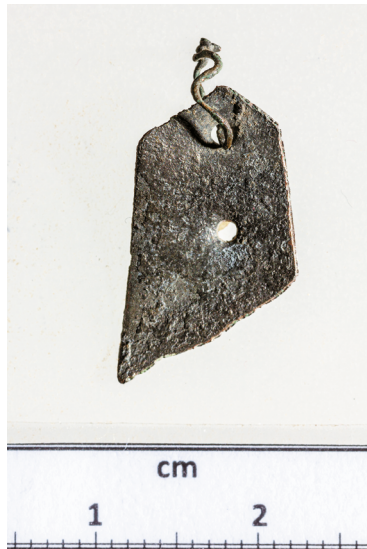
4a-b. kép. Flitterek Tamási-Adorjánból