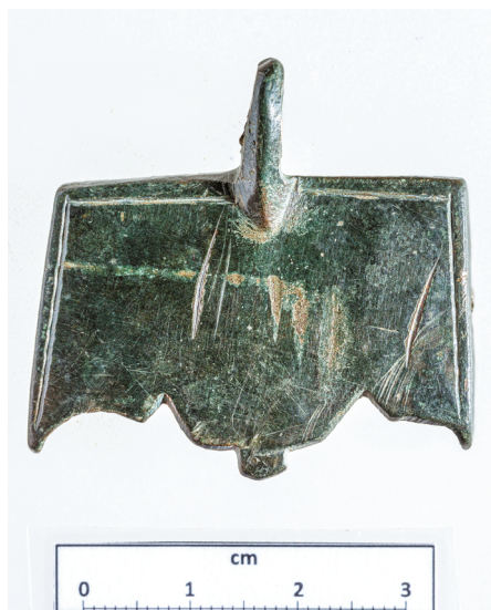
13. kép. Szamárhátíves kapocs Tamási-Henyéről