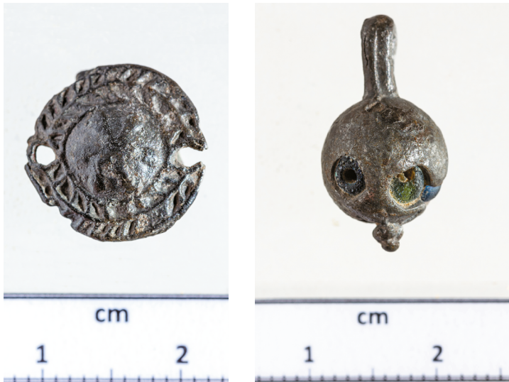
15a-b. kép. Kerek, domború közepű ólom fülesgomb Nagyszokoly-Szentmártonról és üvegyöngy közepű ón fülesgomb Tamási-Henyéről

ségű anyagból készített gombok testének közepén olykor láthatóvá válik a gomb magját alkotó, sötét színű (leggyakrabban kék vagy zöld) üvegyöngy, olykor több is (15b. kép). Henyéről kettő, Nagyszokoly-Szentmártonból egy ilyen került elő, de más telepekről (pl. Pálfa-Rácegres) és egy valószínűleg balkániakhoz köthető temető helyéről is ismert (Tamási-Szemcse, kétszer átfúrt 17. századi hamis denárral együtt).