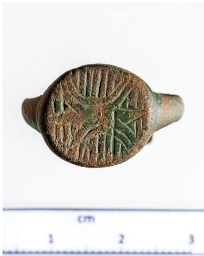
8d. kép. Geometrikus díszű gyűrű Tamási-Henyéről