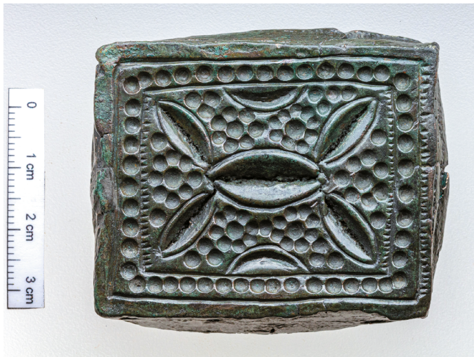
16. kép. Préselőtő Pincehely-Gyántról

Pincehely és Zomba határából került elő egy-egy – lapos, illetve nyeles – bronz préselőtő, amelyekkel téglalap alakú, geometrikus díszű, préselt réz- vagy ezüstlemezeket készítettek (16. kép); 79 utóbbiak két példánya Szakály határában bukkant fel. Ilyen lemezeket a Belgrád környékén (Dunadombó/