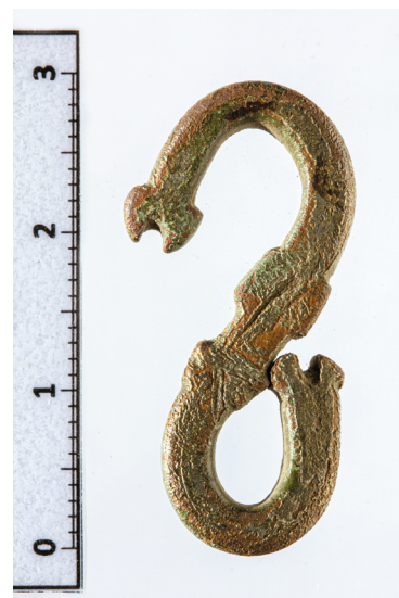
14. kép. S alakú zárókampó Pincehely-Dorogról

kat, amelyek egyik végéhez gyakran karika kapcsolódik. Bár funkciójukra több ötlet is felmerült, elfogadhatjuk Horváth Terézia véleményét, aki mentéhez vagy férfi posztúujjához való szabályozóláncos kapocspár záróelemeként határozta meg őket. 73 Nem sokkal később Wicker Erika közölt egy díszes kidolgozású, sárkányfejekben végződő kampót Szeremléről, amit övkapocs részének vélt. 74 Mindketten hangsúlyozták, hogy a tárgytipusnak térben és időben tágabb, Nyugat-Európára és a késő középkorig visszanyúló párhuzamai is vannak. Ugyanakkor Koszovóból is ismert egy hasonló, 16. századra keltezett kampó, amely kapocspár két részét fűzi egymáshoz. 75