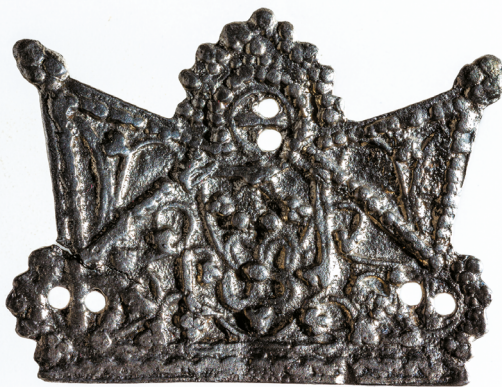
11. kép. Korona alakú ezüstkapocs Tamási-Henyéről

két-két átfúrt lyuk van, a bonyhádin és a zombain azonban csak egy, míg a kocsolain egy sem. Utóbbi valószínűleg félkész darab lehet, mert felülete teljesen díszítetlen; nem lehetetlen, hogy helyben készítették. A faddi és a zombai kapcsón megmaradt a két akasztóhurok, a tamási példány hátlapján pedig két felforrasztott kampó van, ami alapján a kapocs egymásba akasztható két félből állt.