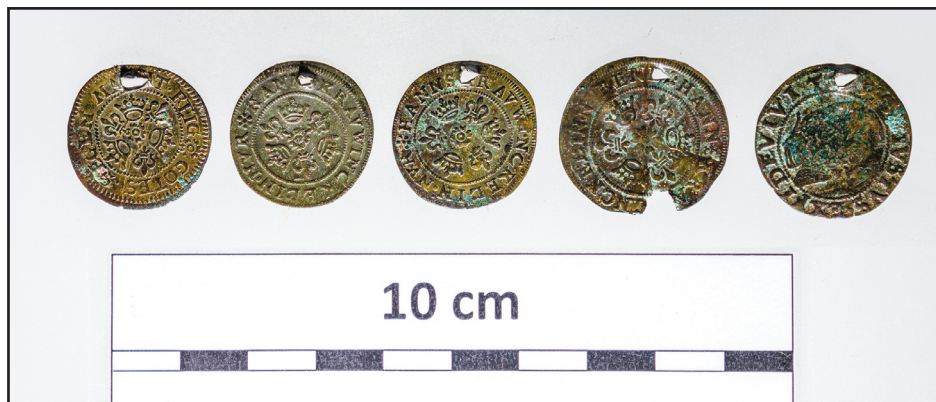
3. kép. Átfúrt nürnbergi zsetonok Sárszentlőrincről

helyen átfúrt – tehát egykor felvarrva, fellógatva viselt – számolózsetont ismerünk. Többségük Nürnbergben készült a 16. század közepe után, a Krauwinckel vagy Laufer család műhelyeiben. Sárszentlőrinc-Alsórácegrespusztja térségében kiszántott embercsontok mellett egy csomóban négy, átlukasztott számolózseton és egy 1545-ös porosz garas került elő (3. kép), amelyeket egykor valószínűleg fejdíszre varrva viseltek. A zsetonok közül hármat Hanns Krauwinckel II. (+1635), egyet pedig Mathäus Laufer (+1634) nürnbergi számológemester bocsátott ki.