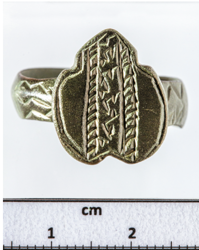
9. kép. Csepp alakú bronzgyűrű Gyulaj-Biródról