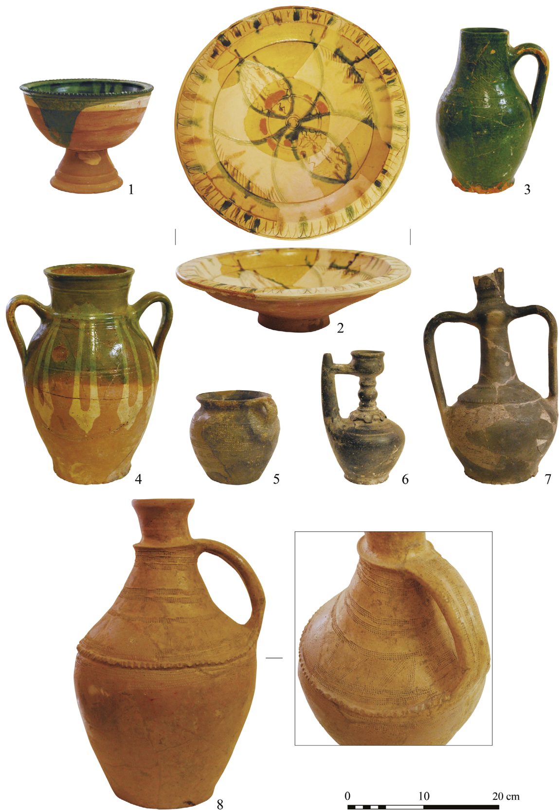
12. kép. Oszmán asztali és konyhai edények a pécsi Püspökvárból. G. Sándor Mária és Gerő Győző ásatása. Leletanyag: Janus Pannonius Múzeum gyűjteménye, Pécs