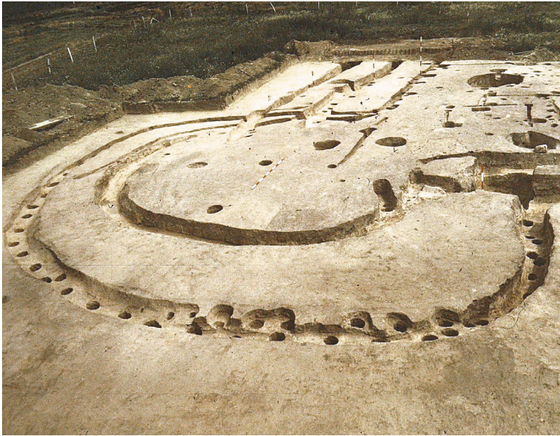
3. kép. Szekszárd-Újpalánk, a palánkvár északnyugati bástyája