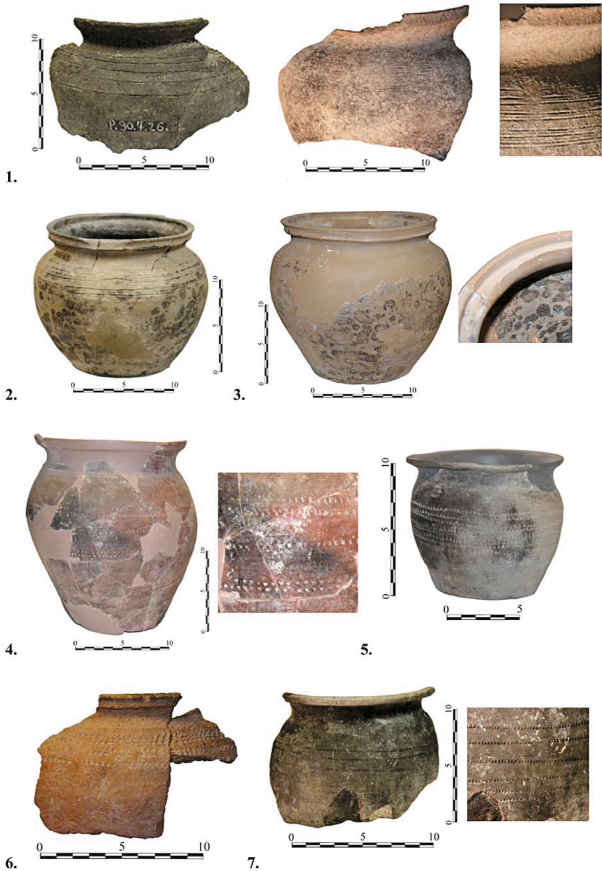
9. kép. Szekszárd-Újpalánk. Hódoltságkori kézi korongolt fazekak és fazekak töredékei (GAÁL 2013, 7. tábla nyomán)