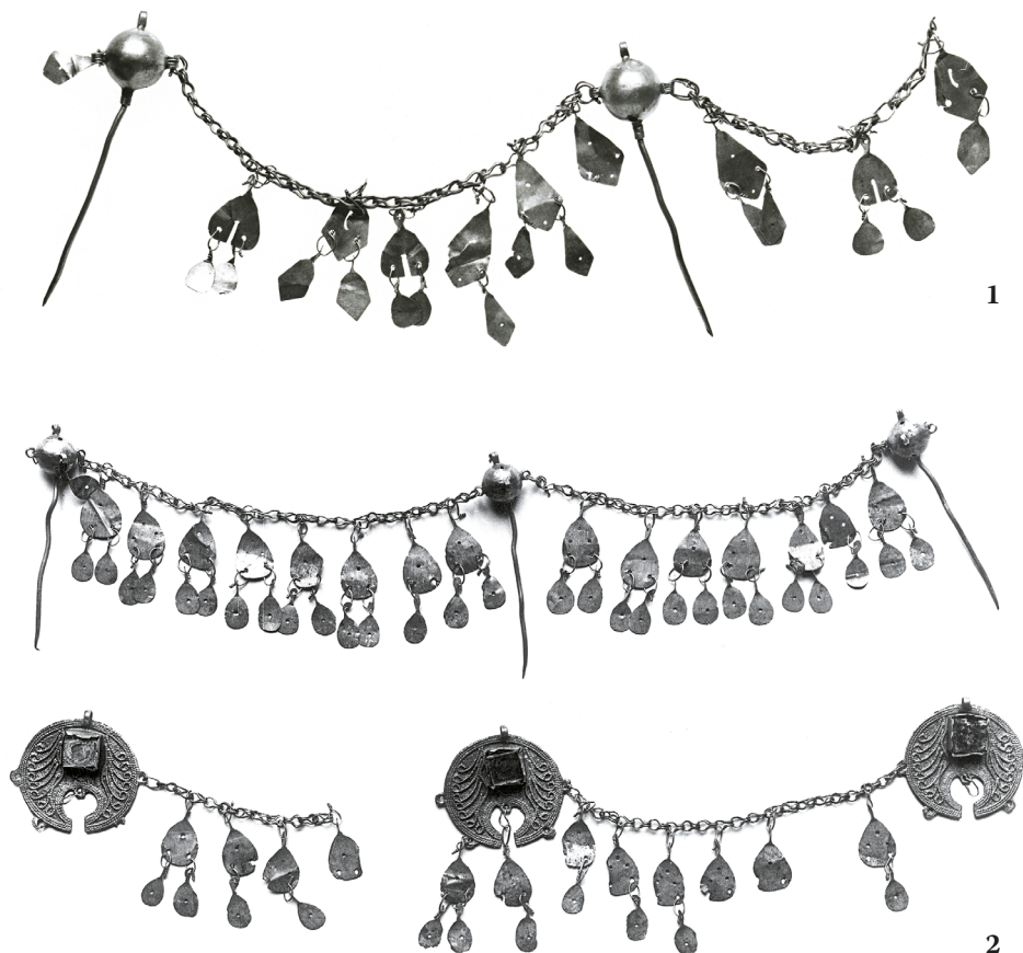
13. kép. Balkáni törökös ékszerleletek. 1: Kajdacs, Tolna megye; 2: Battonya (GERELYES 2010, 793, 12–13. ábra nyomán)

A kézi korongolt edények évszázadok hagyományait örökítik, e durva kerámia szerte a Balkánon fellelhető a 15–20. században, régészeti és néprajzi anyagban egyaránt. 74 Etnikumhoz nem köthető. A Balkánon a kézi korongolt kerámia keltezése – miután őrzi tradicionális jellegét – nem könnyű, a régészeti anyagot több esetben a középkorra vagy a 14–17. századra helyezik, ugyanakkor nem egyszer találkozhatunk a magyarorszáigival összhangban lévő 16–17. századi keltezéssel is (pl. Belgrád).