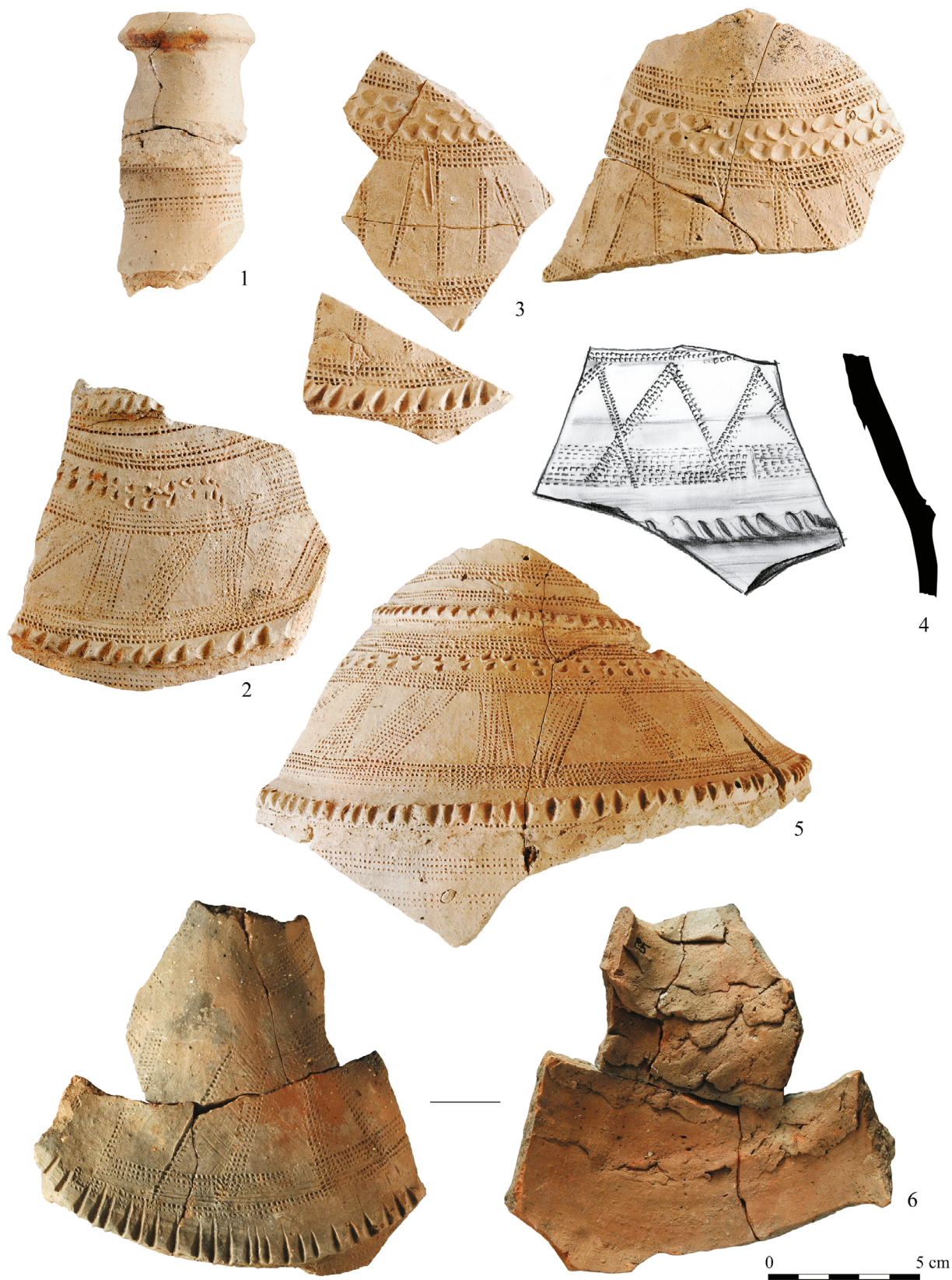
11. kép. Ún. bosnyák korsók töredékei a barcsi török palánkvárból. Leletanyag: Dráva Közérdekű Muzeális Kiállítóhely (korábban Dráva Múzeum), Barcs (rajz: Ősi Sándor, MTA–BTK Régészeti Intézet Adattára)