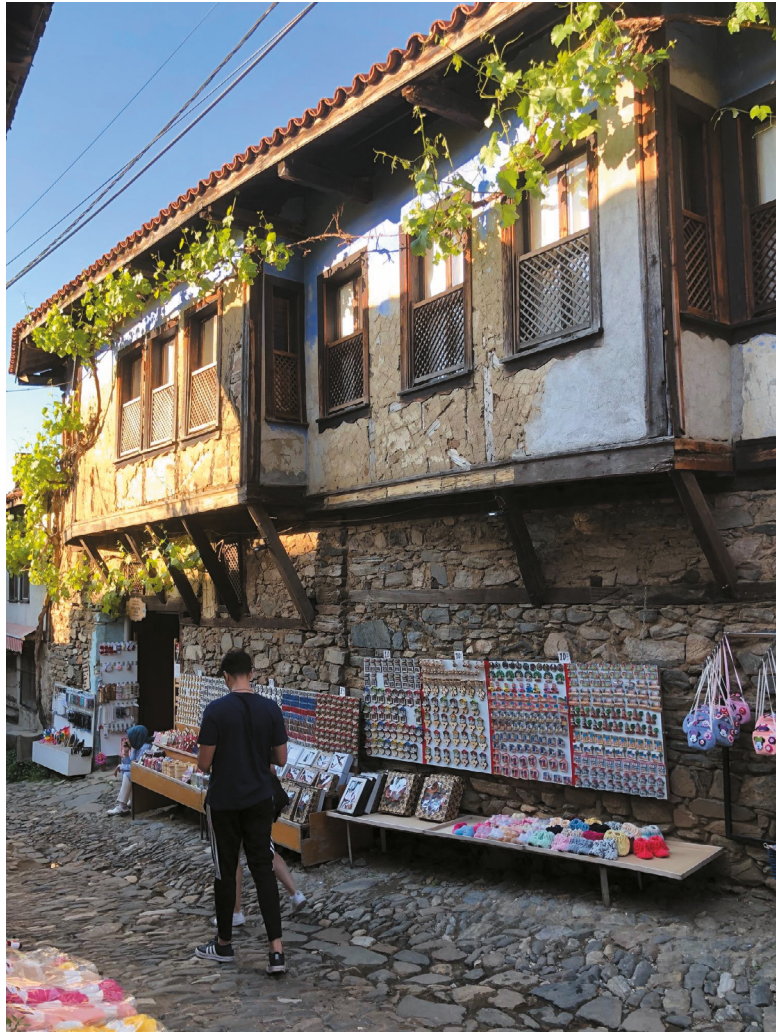
1. kép. Oszmán kori lakóház, Cumalıkızık, Bursa külvárosa