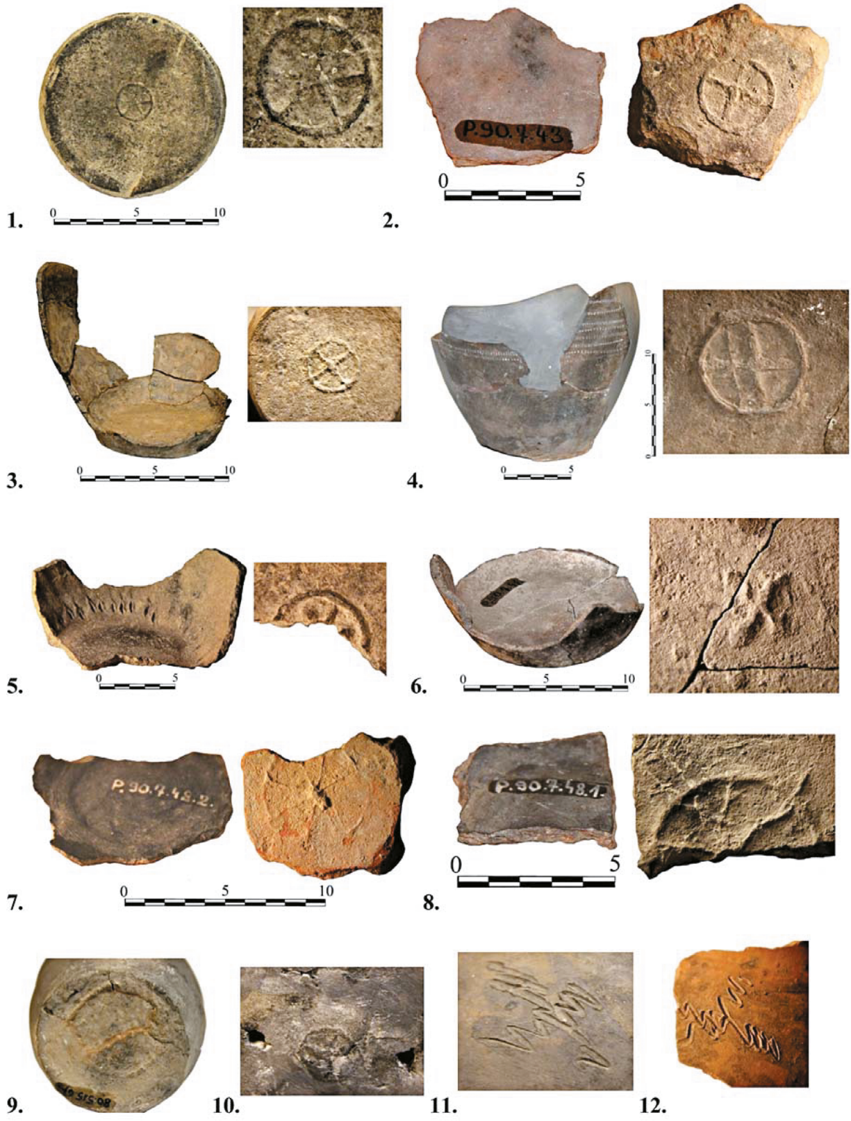
10. kép. Szekszárd-Újpalánk. Fenékbélyegek hódoltságkori kézi korongolt fazekakon (GAÁL 2013, 13. tábla nyomán)