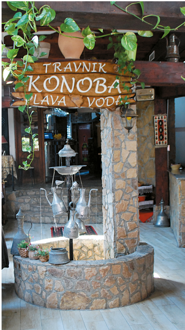
14. kép. Rézedények kút díszeként egy mai étteremben, Travnik, Bosznia-Hercegovina

népek keresendők, amelyek a kézi korongolt kerámiát készítették és használták. Meg kell jegyezni, hogy függős, csüngős ékszereket különböző változatokban a Balkánon, Anatóliában a mai napig készítenek.