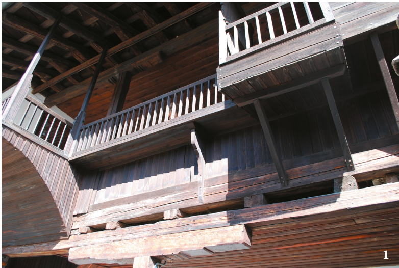
2. kép. Szarajevó, a 18. századi Svrzo-ház. 1: A fából készült emelet részlete; 2: Szemes kályha az emeleten