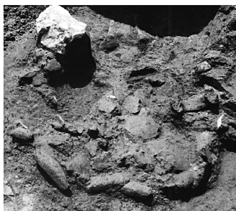
7. kép. Sütőtál töredékei feltárás közben, Szekszárd-Újpalánk (GAÁL 2015, 148, 3. kép 2 nyomán)

Leletanyag: Dráva Közérdekű Muzeális Kiállítóhely (korábban Dráva Múzeum), Barcs