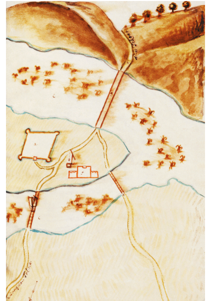
4. kép. Újpalánk erőssége Ottendorff 1663. évi ábrázolásán (OTTENDORFF 1943, 48 nyomán)