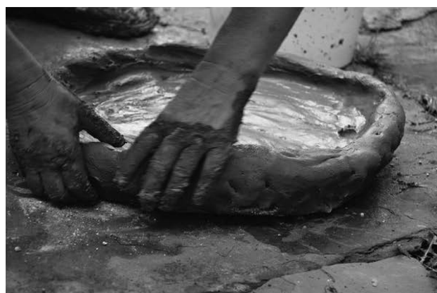
8. kép. Sütőtál készítése a mai Szerbiában (DJORDJEVIĆ 2016, 317, Fig. 26.3 nyomán)