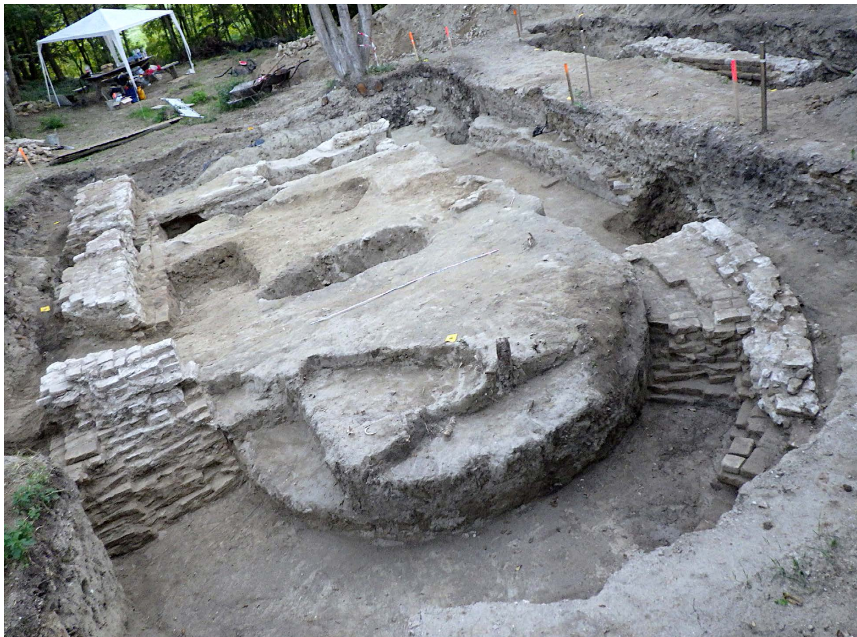
1. kép. A feltárt templom, 2020

vallási vonatkozású tárgyak közül Kisszékelyben nem találtunk rózsafüzérhez tartozó gyöngyöket, oltalomlevelet (breverl) és zarándokjelvényt.