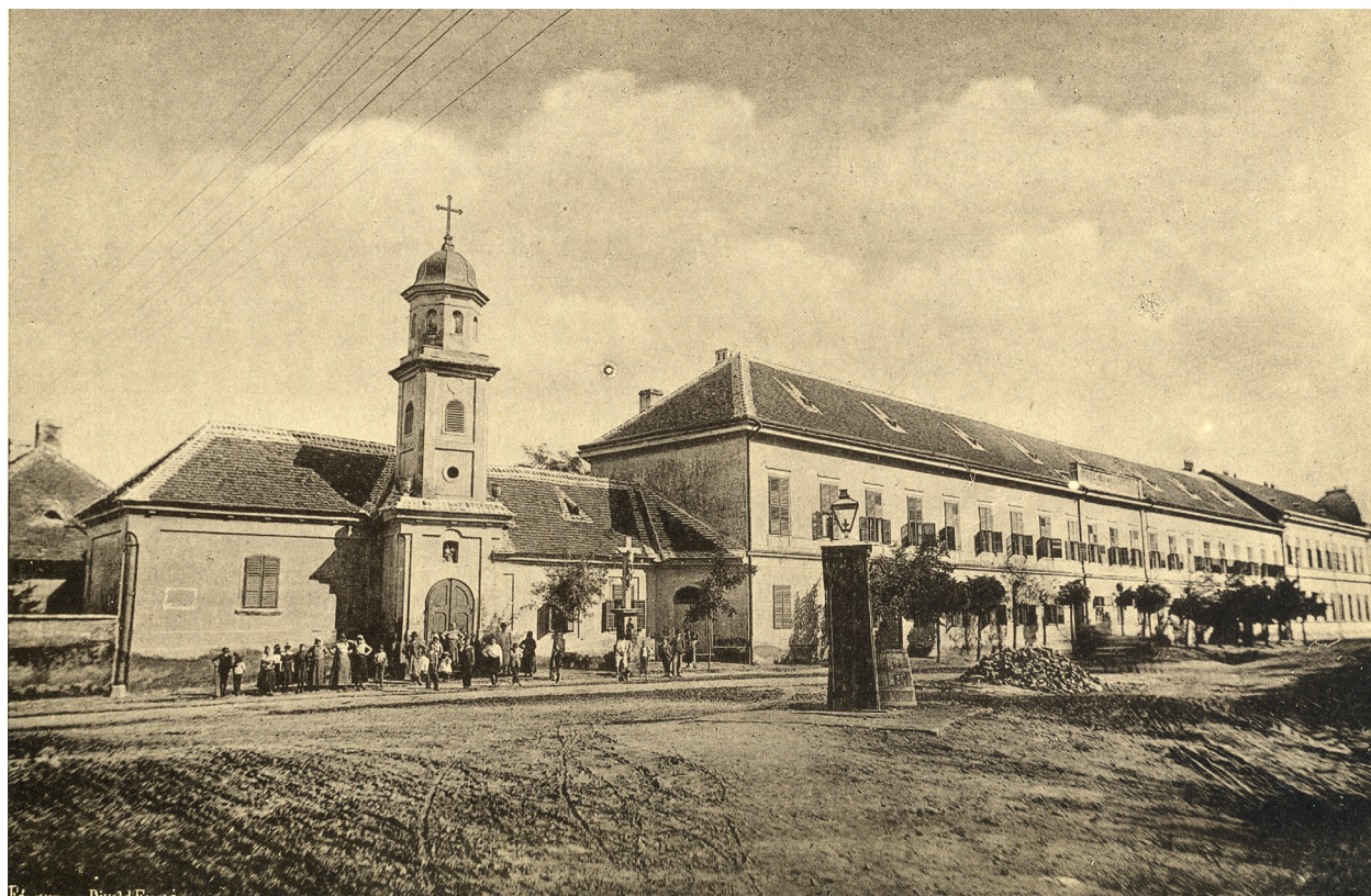
1. kép. A szekszárdi Ferencz Közoktórási Épület (1896 körül)