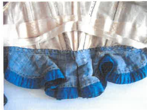
A derék belseje felgőzölés előtt