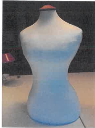
A bábu formára tömve majd bevonva