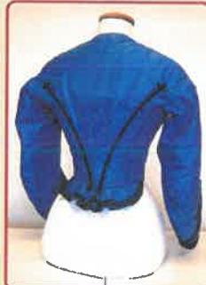
Ruhaderék rekonstrukció vázlat