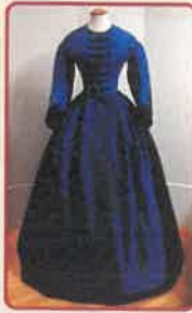
Féltűző, csuklóval díszített ruha

Kék taft selyemből készült, több részből, testre simulórn szabott, kézzel varrott ruhaderék. Középen fekete zsinórozással díszített, horgos kapocccsal összegombolható. Halcsontokkal merevített. Nyakkivágása kerek, zsinóros ferdepántaláldolgozott. Derékvonala elől kissé csúcsos, hátul egyenes és kis, rakott, fekete stíjtással díszített szoknyácskával kiegészített. Hátának íves szabásvonalán fekete stíjtás. Az ívesen szabott, ejtett vállú, egyvarrásos hosszú ujjú fekete stíjtással és paszománnyal díszített. A testrészt fehér pamutvászonnal, az ujját gazdával, a csuklónál selyemmel bélelt. Az elejében fehér vászonból filzösszerű betoldás. A derék vonalán övszalag és kötöző szalag. A műtárgy valószínűleg a Perczel családtól került a múzeum gyűjteményébe. A ruhaderéket Kralovánszky Mária 2019-ben restaurálta, és elkészítette a szoknyarész rekonstrukcióját is.