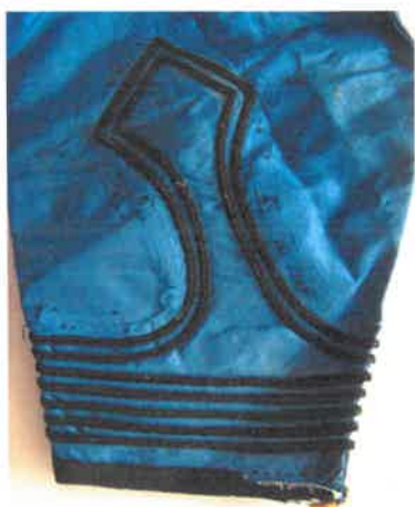
Bal ujjának hiányos sújtása