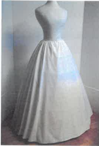
Az első alsószoknya az abroncs szoknyán