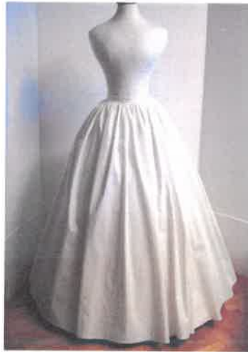
A második alsószoknya