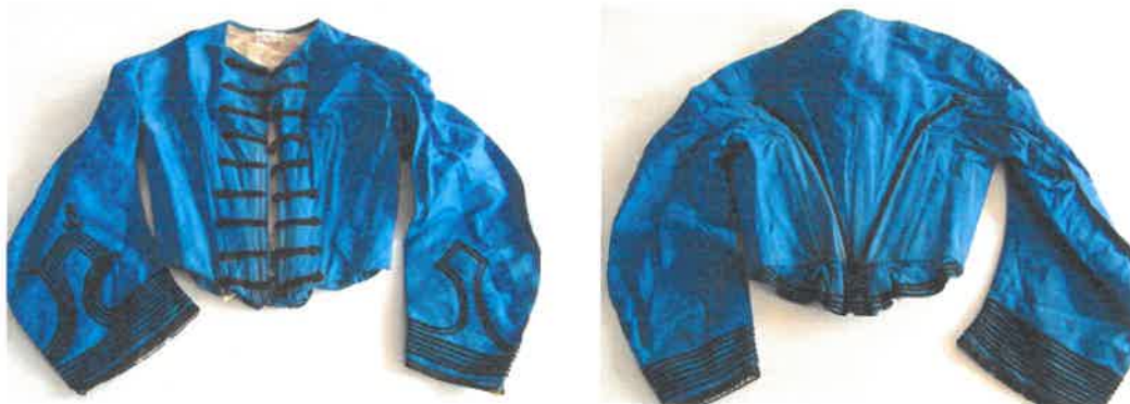
A ruhaderék eleje és háta restaurálás előtt

Kék taft selyemből készült, több részből testre simulóra szabott, kézzel varrott ruhaderék. Az elől közepén horgos kapcsokkal, illetve fekete zsinórozással összegombolható derék halcsontokkal merevített. Nyakkivágása kerek, zsinóros ferdepánttal eldolgozott. Derékvonala elől kissé csúcsos, hátul egyenes és kis rakott, fekete sújtással díszített szoknyácskával kiegészített. Hátának íves szabásvonalán fekete sújtás. A nagyon ívesen szabott, ejtett vállú, egyvarrásos hosszú ujjá alul, felül bő, alján fekete sújtás és paszomány. A testrészt fehér pamutvászonnal, az ujjá fehér gazeval, a csuklónál selyemmel bélelt. Az elejében fehér vászonzól fűző szerű betoldás. A derék vonalán övszalag és kötöző szalag.