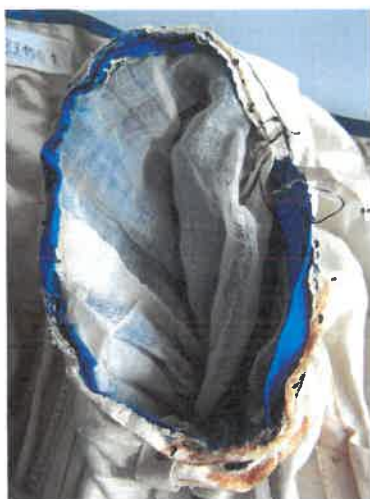
A bal ujjá gépi bevarrása