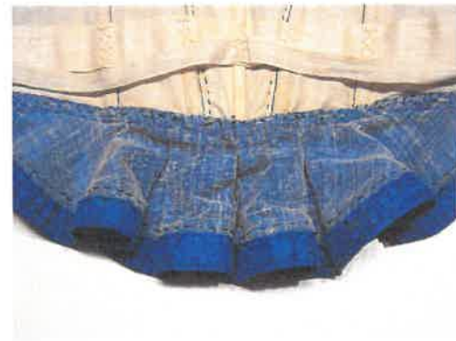
A derék belseje felgőzölés után