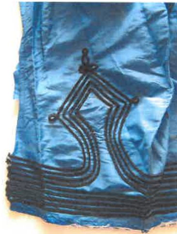
A hiányzó sújtás kipótolva