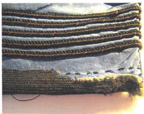
A szakadt gyapjú szalag