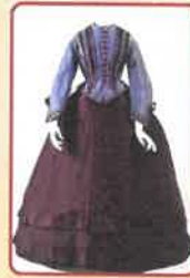
Ruhaderék az 1860-as évből