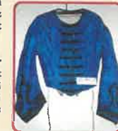
Ruhaderék rekonstrukció vázlat