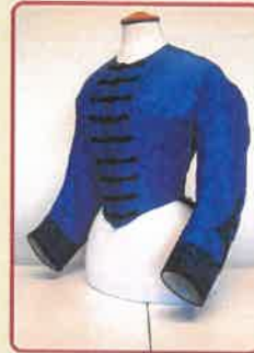
Ruhaderék rekonstrukció vázlat

Újkortörténeti gyűjtemény Leltári szám: 83.150.1. Mellbőség: 86 cm Derékbőség: 62 cm Hátá hossza: 40+6 cm Ujjá hossza: 52 cm