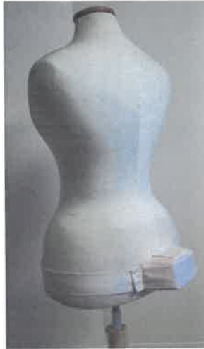
Az abroncsos szoknya ovális formáját biztosító „távtartó” a bábun

A derék bőrsége szalaggal összehúzható. Az eleje közepe csillaggal van jelölve.