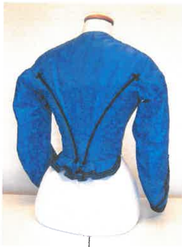
A ruhaderék háta restaurálás után