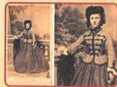
Ruhaderék az 1860-as évből

IV. A szakmai beszámolót elhelyeztük a Wosinsky Mór Megyei Múzeum honlapján wmmm.hu