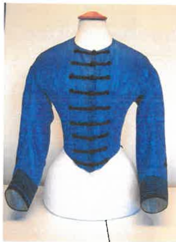
A ruhaderék eleje restaurálás után