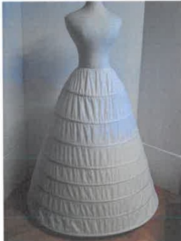
Az abroncs szoknya