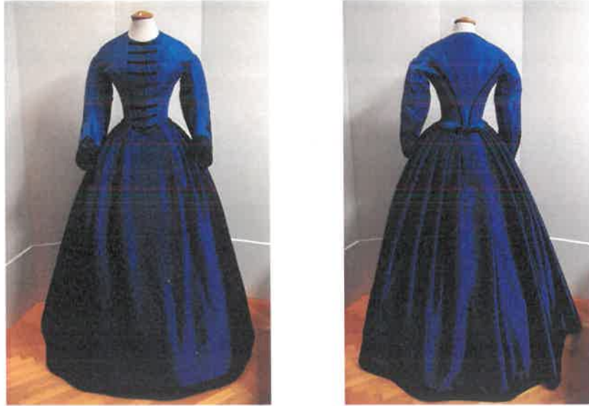
Az elkészült ruha